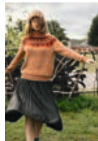
TURIST Alpaka Design 10