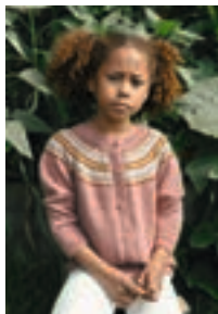
SONNYBOY Mini Alpaka Design 8