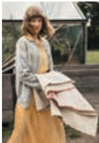
LOFOTEN Sisu Design 1