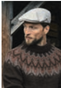
TURIST Peer Gynt Design 2