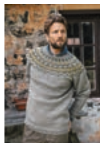
TROLLSTIGEN Peer Gynt Design 17