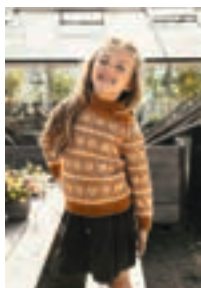
LILLEMOR Mini Alpaka Design 14