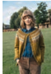
SMØRBUKK Tove Design 4