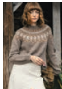
TROLLSTIGEN Alpaka Ull Design 16