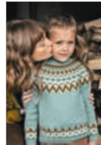
SMØRBUKK Babyull Lanett Design 5