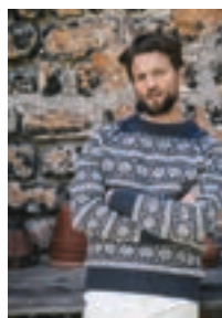
LILLEMOR Peer Gynt Design 15