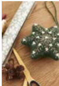
STJERNE Fritidsgarn Design 7