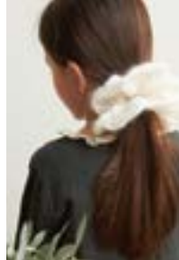
FLEURSCRUNCHIE Tynn Silk Mohair Design 4