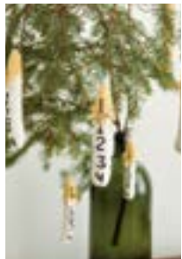
PETITE CHRISTMAS CANDLE Tynn Peer Gynt Design 10