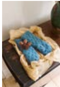
JOELVOTTER Fritidsgarn Design 13