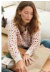
FLEURDELIS Double Sunday Design 12