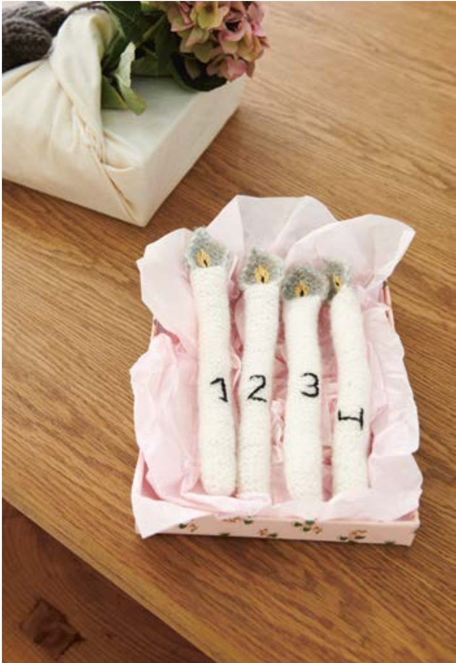
TEMA 77 | TYNN PEER GYNT + TYNN SILK MOHAIR | \times 3 | \frac{\text{AAA}}{27 | 10} | •• CHRISTMAS CANDLE