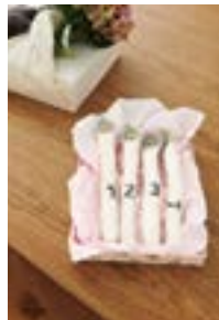
CHRISTMAS CANDLE Tynn Peer Gynt + Tynn Silk Mohair Design 9