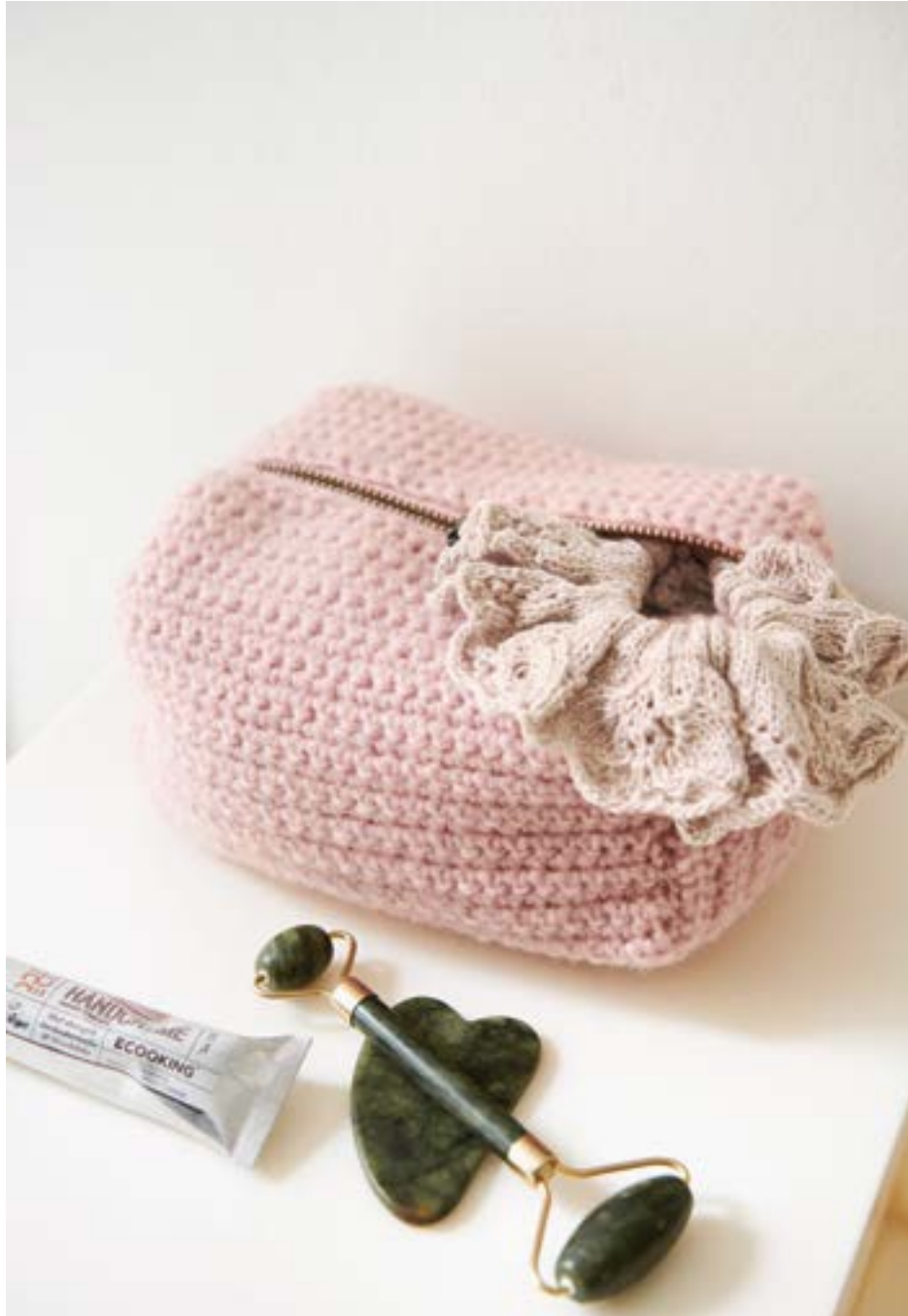
TEMA 77 | TYNN LINE | \times 2\frac{1}{2} | \frac{7777}{28 | 10} | ... FLEUR SCRUNCHIE TYNN LINE EDITION