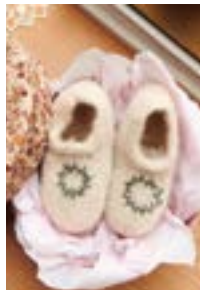
CHRISTMAS SLIPPERS Fritidsgarn Design 8