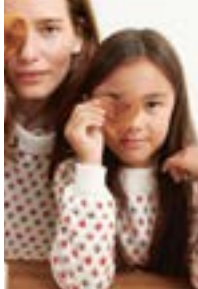
FLEURDELISBARN Tynn Merinoull Design 1