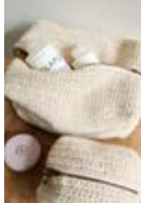
JULIETTEBAG Fritidsgarn Design 2