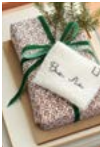
CHRISTMAS LETTER Tynn Peer Gynt Design 6