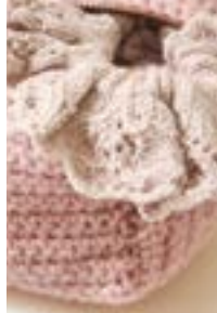
FLEURSCRUNCHIE TYNN LINE EDITION Tynn Line Design 3