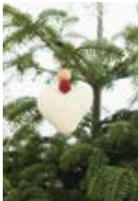
JULEHJERTE Tynn Peer Gynt Design 11