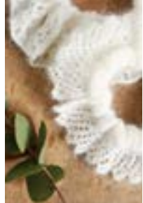
LACE SCRUNCHIE Tynn Silk Mohair Design 5