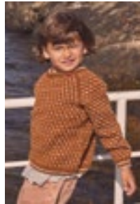
ISLENDER GENSER Babyull Lanett Design 1