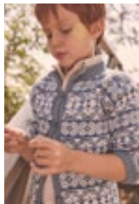
LUNDEKVAM KOFTE Babyull Lanett Design 5