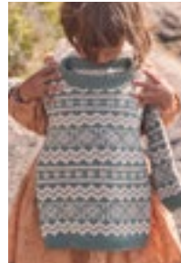
VALLDAL GENSER Smart Design 3