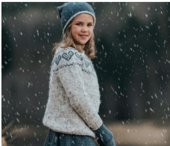
Hjertegenseren i grå | DSA73-01