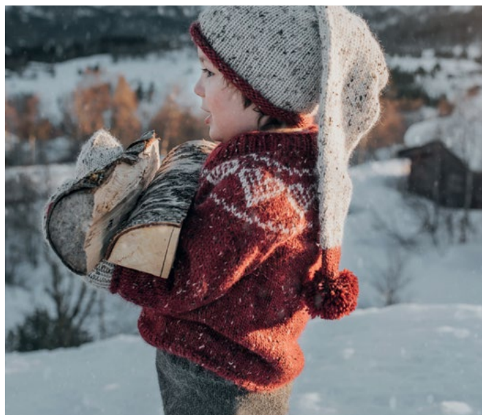
Hjertegenseren i dyp rød | DSA73-02