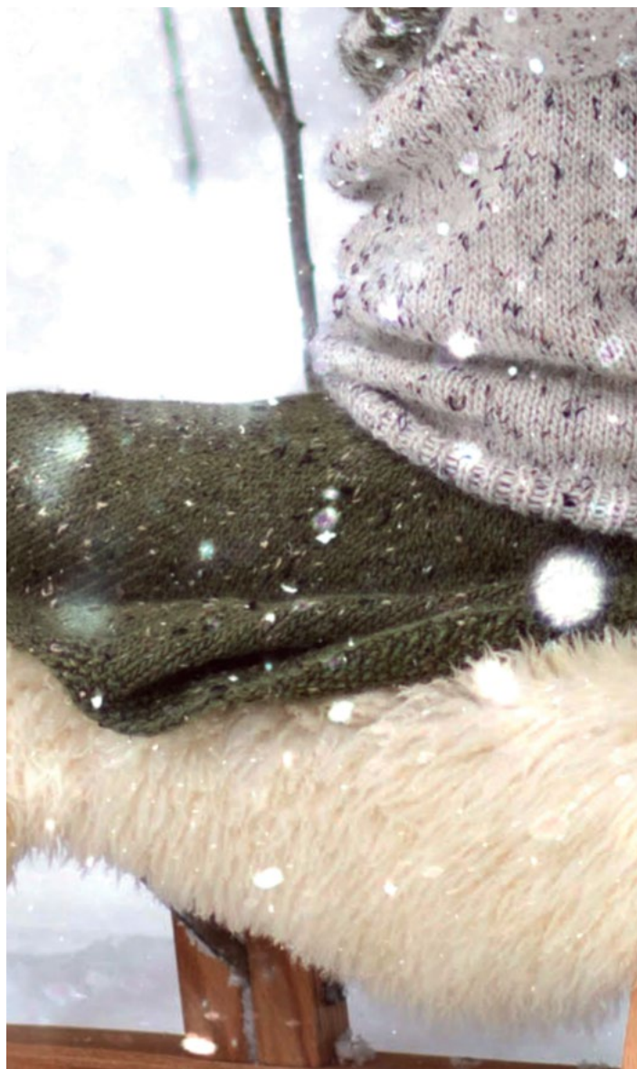
Snurreskjørt i natur, DSA73-29.

Brett belegget i livet mot vrangen og sy til med løse sting, men la det stå igjen en liten åpning. Trekk elastikk i løpegangen.