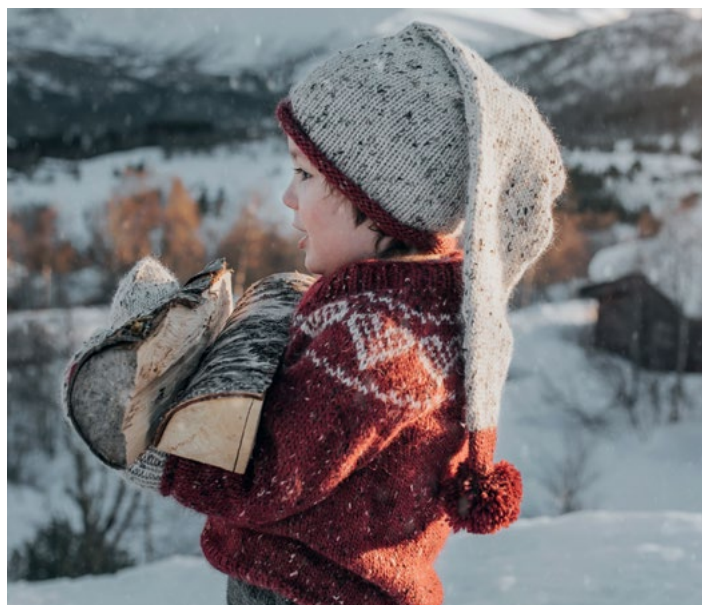
Prøv genseren i dyp rød | DSA73-02