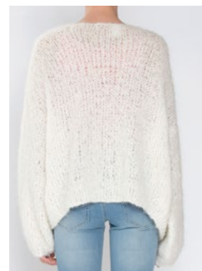
Se også CP-40 DANDELION FNUGG Hvit 902