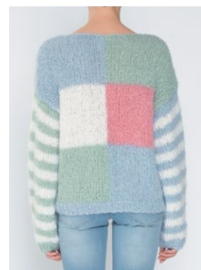
FNUGG Hvit 902, Jadegrønn 913, Myk korall 910, Himmelblå 904