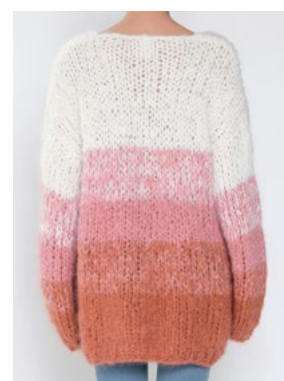
Se også CP-29 TULIP FNUGG Hvit 902, Myk korall 910, Aprikos 911