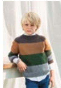
BILLYS STRIPEGENSER Double Sunday Design 9