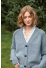
NOOMI JAKKE Double Sunday Tynn Silk Mohair Design 1