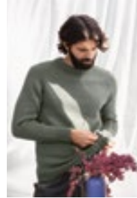
HERMANGENSER Double Sunday Design 4