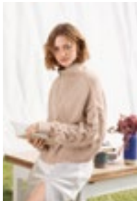
SIENNA ZIPPERGENSER Double Sunday Tynn Silk Mohair Design 6