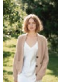
HENNIE JAKKE Double Sunday Tynn Silk Mohair Design 5