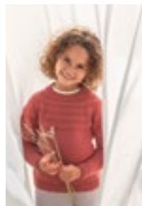
ALFREDS RILLEGENSER Double Sunday Design 13