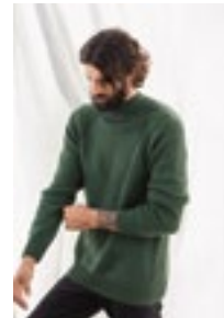
LYNNS GENSER Double Sunday Design 10