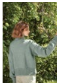
ELLE GENSER Double Sunday Tynn Silk Mohair Design 12