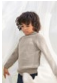
LYNNS GENSER Double Sunday Design 8