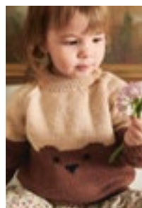
BJØRNEGENSER Merinoull Design 10