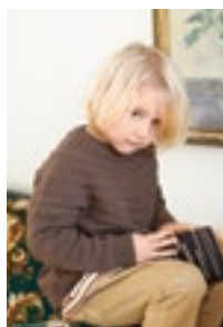
ALFREDS RILLEGENSER Tynn merinoull Design 7