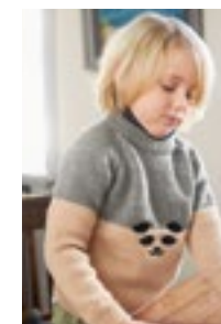
PANDAGENSER Merinoull Design 11