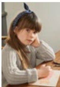
PETERSRIBBGENSER Sunday Design 2