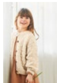
POPCORN JAKKE Børstet alpakka Tynn silk mohair Design 6