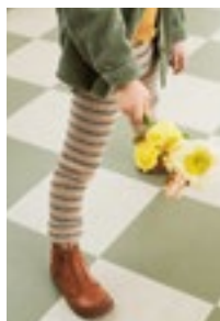
PAULS PERLERIBBUKSE Sunday Design 1