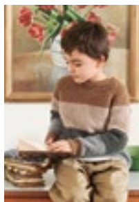
BILLYS STRIPEGENSER Kos Design 3