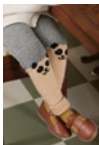
PANDABUKSE Merinoull Design 9