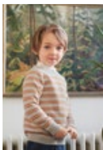
SIMPELTHEN STRIPEGENSER Sunday Design 8