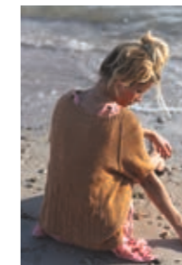
KORNÅKER T-SKJORTE Design 8