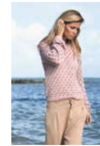
LØVGENSER Design 3