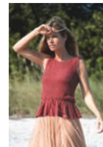
YNDIG TOPP Design 6