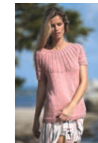
MOSETOPP Design 10