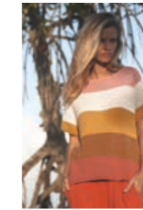
STRIPE-TEE Design 4