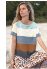
STRIPE-TEE Design 4