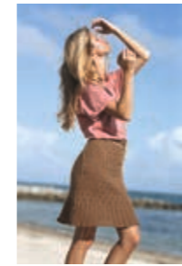
YNDIG SKJØRT Design 2