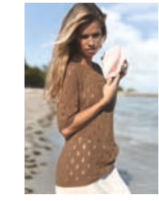
KLØVERTOPP Design 5