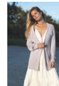
KORNÅKER JAKKE Design 9