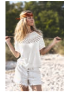
PEONTOPP Design 1