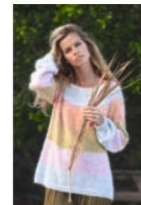
REGNBUEGENSER Design 7